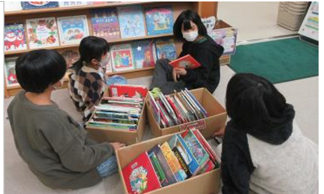
ロビーのテーマブックコーナーに季節のえほんをならべます。クリスマスは、きれいな絵本がいっぱい！

みビ図書 んッ館 なクな でブお 読ッた んクの でもが しあみ たのし のす。 しいね。 には、