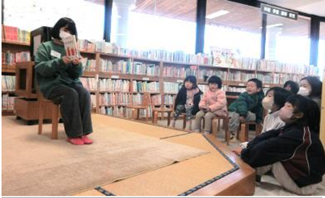
土曜日のおはなし会で、えほんを読むメンバー。子どもたちは、うれしそうに聞いています。