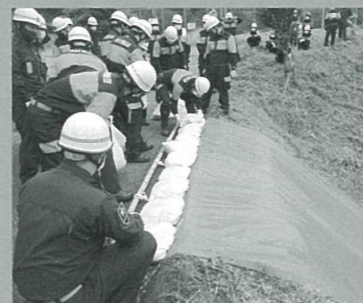
消防団水防訓練より

A 近年の集中豪雨は村内でも被害が多発し、雨水排水対策は直面する課題である。対策とする水路改修は地域の要望等も踏まえ改修箇所を選定し事業化していきたい。