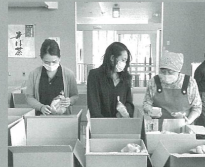
ふるさとのお届け作戦

A 今後第2号補正として、10月から村内事業所で利用できる、村民一人当たり2万円分の商品券の発行、総売上額が一昨年に比べて15%以上減少された事業者へ上限30万円の事業持続化給付金の継続、学生へのふるさとのお届け作戦第2弾、管外に居住しアルバイト収入額が減少している学生への生活応援給付金等、村民生活の安定に寄与することを考えていきます。