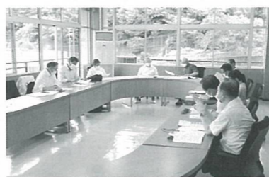
7/6 全体会議のようす

今後とも村民の皆様温かいご支援、ご指導をお願い申し上げます。就任のご挨拶とさせていただきます。