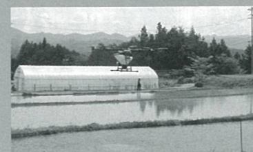
ドローンによる空中散布