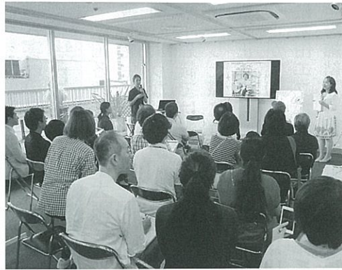
9月9日に東京で行われた移住イベント

お話し住宅が始まりました。私自身、村に移住して約三カ月が経ちました。現在行っている移住・定住促進事業としては、首都圏で行われる移住希望者向けの移住イベントに参加して村のPRをしたり、この十月からは「お試し住宅」を開始しております。「お試し住宅」とは、移住をご検討されている方の為に、一度村へお越しいただき、SNS等では伝えきれない下條村の事を、実際に生活し移住を判断される際のご参考にしてもらう事を目的としています。村の気候や環境などを体験し、希望される移住先としてご検討いただけるように橋渡しのような活動しております。