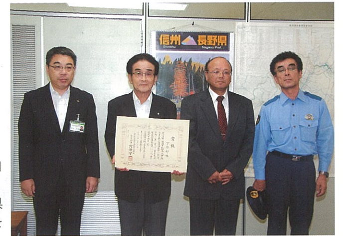
▶ 2010年10月25日、睦沢地籍の国道151号線で軽自動車の女性が亡くなった事故以来死亡事故はなく、7月21日に交通死亡事故ゼロ1000日を達成し、県交通安全運動推進本部長(阿部守一知事)顕彰を受けました。