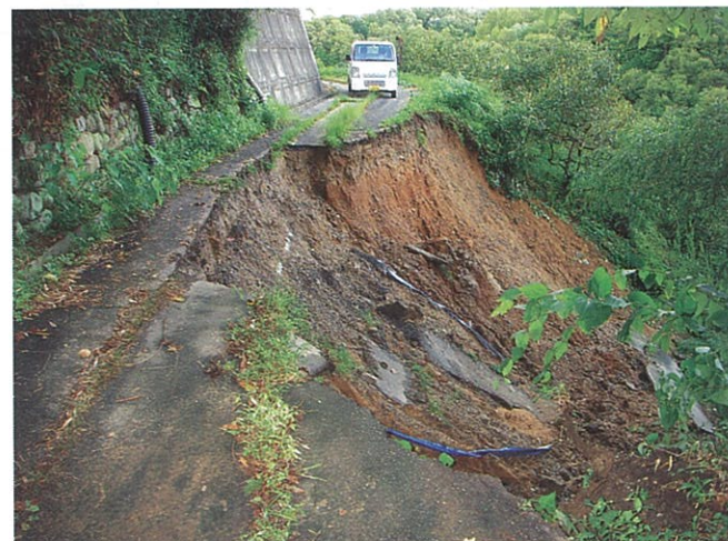
(林道53号線小松原地籍)