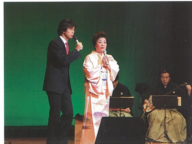
▲ 9月28日 下條村コスモホール開館10周年記念行事として、NHKラジオ番組「民謡をたずねて」の公開放送がコスモホールで行われ、約300余人の皆さんが民謡を満喫しました。