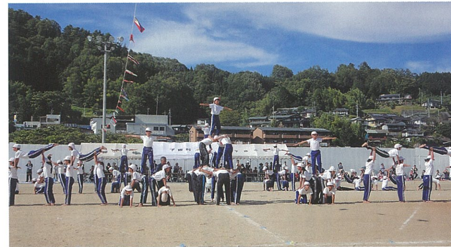
◀ 9月28日 小学校運動会が秋晴れのもと開催され、児童の皆さんは各種目とも元気いっぱい競技をしました。(関連記事9ページ)