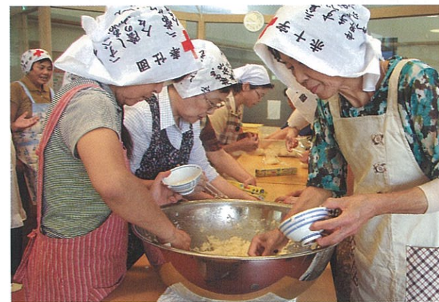
▲ 9月3日 日赤奉仕団約35名による炊き出し訓練がいきいきらんど下條で行われました。