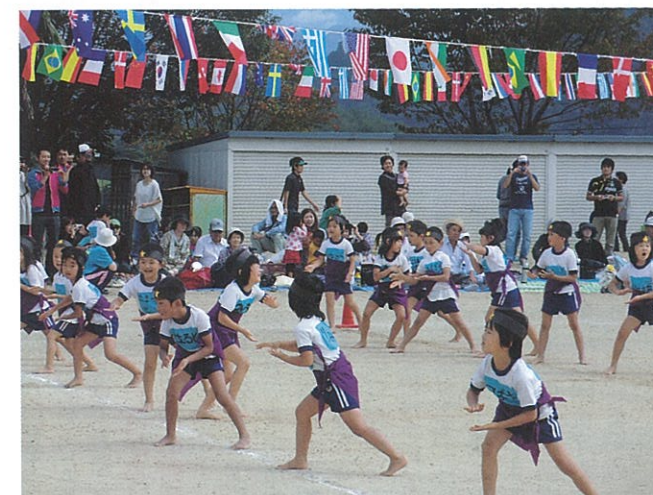
▲ 10月5日 保育所運動会が開催されました。かわいくて元気いっぱいの姿に会場は和やかな雰囲気となりました。(関連記事8ページ)