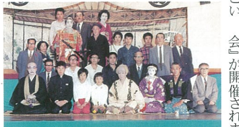
昭和48年10月18日 川路小学校 下條歌舞伎保存会による『一谷嫩軍記熊谷陣屋』