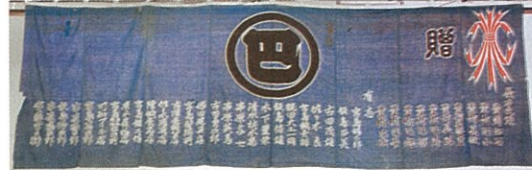
歌舞伎資料展にて展示中の『巴の会』の幕