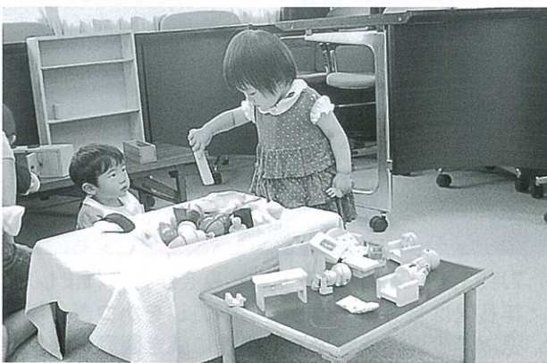
平成21年度に行った「世界のおもちゃ広場」