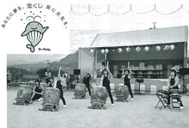
購入した和太鼓(阿知原のお祭りにて)