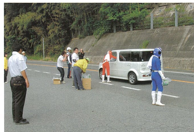
▲ 5月29日 阿南警察署・安協下條支部・下條村共同主催で、ゴミゼロ運動の啓発活動がカッセイカマンの協力を得て行われました。