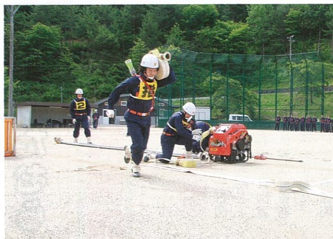
▲▶ 6月24日 村消防総合訓練が村民グラウンドで開催され、小型ポンプ操法・救急法の技術大会と救護班・ラッパ班の公开发表が行われました。