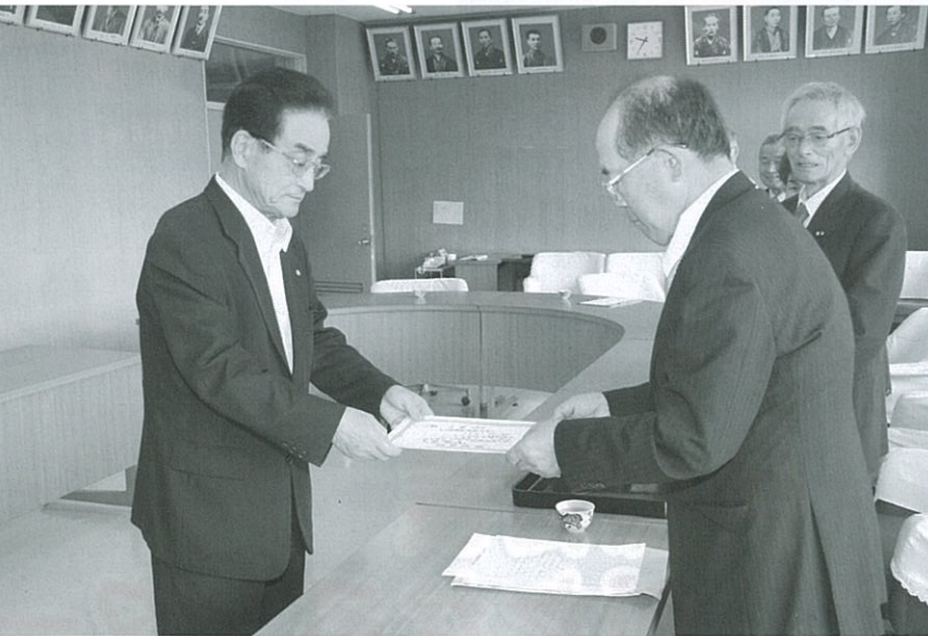
選挙管理委員会委員長から当選証書の授与

て、少子化時代の中で、女性の出生率は二・〇四人と県下では一位を保っています。 こうした実績をふまえ、子育て支援も更に充実し、学校教育では故郷愛を育み、又、国際社会に対応出来るユニーク教育の支援、産業振興では、三遠南信自動車道の部分供用・リニア開通を目前に控え、広域行政の中で、交流人口、又定住人口増を図り、より活発なる農・商・工業の発展を図ります。 又、今日の下條村の基礎作りの中心として頑張られた皆様の医療を含めた福祉施策の充