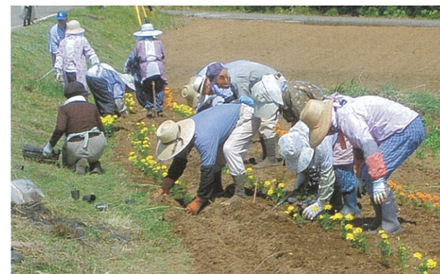
▲ 6月14日 「花いっぱい運動」の苗の植え付けを老人クラブの皆さんの協力により、村内の道路沿いで行われました。今年はマリーゴールドとサルビアです。