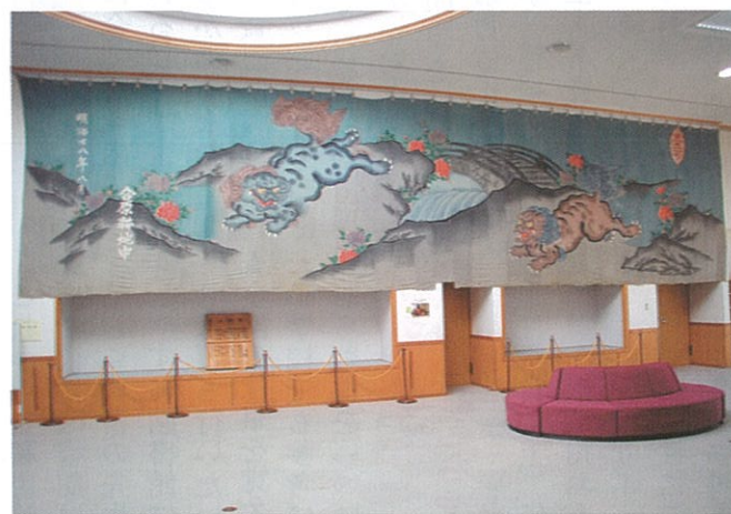
▲ 1895年(明治28年)に制作された歌舞伎の引き幕が合原地区で見つかりました。たて4メートル、横15メートルで、獅子に牡丹の絵柄が描かれています。