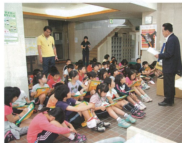
▲ 6月8日 小学校3年生46人が総合学習の授業で役場を見学しました。役場の業務の一端や村づくりについて理解を深めました。