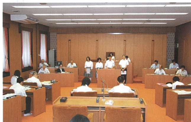
▲ 7月19日 中学生による模擬議会が役場議場で開催され、環境・交通・自然保護・施設整備に関する提案が出されました。