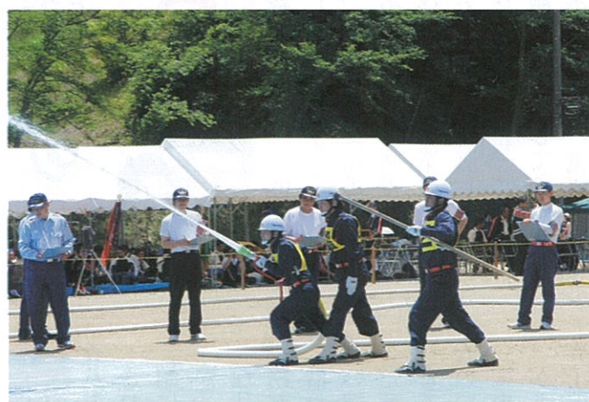
▲ 7月8日 飯伊消防技術大会が阿南町富草グラウンドで開催され、小型ポンプ操法の部には第1分団が、ラッパ吹奏の部にはラッパ班が出場し、訓練の成果を発揮しました。