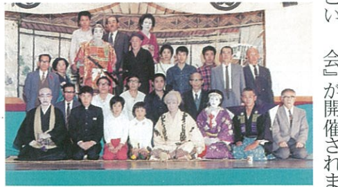
昭和48年10月18日 川路小学校 下條歌舞伎保存会による『一谷嫩軍記熊谷陣屋』