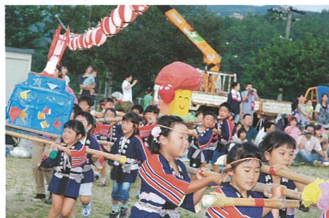
▲ 7月23日 保育所親子お楽しみ会が行われました。年長児は自分達で作ったおみこしをかつぎ、年中児、年少児、未満児もその後につき園庭を練り歩きました。