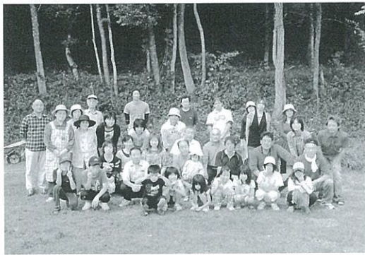
新中原区のみなさん