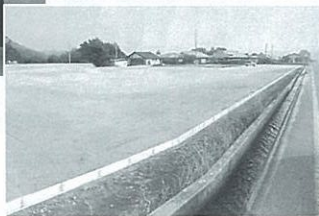
完成した工場用地

阿知原地区にトーア電子の工場用地が完成!! 調印式が行われました 本年度、企業誘致を進めるなか、エス・アイ・テックの取引先で愛知県名古屋瑞穂区に拠点を置く(株)トーア電子が、昨年開通した三遠南信自動車道天龍峡ICからも近く、新工場建設に条件がよいことから、進出が決定。九月十日に工場の敷地造成が完成しました。九月十七日には、エスアイテック会議室において、村とトーア電子による、工場用地の譲渡にかかる調印式が行われました。 今後、工場建設が二月末までに行われ、四月から本稼働となる予定です。