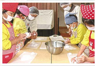
園児と日赤奉仕団 による餅つき・ 鏡餅づくり

世帯数：1,288戸 人口：3,560人 男：1,720人 女：1,840人 (2022(令和4)年12月1日 現在)