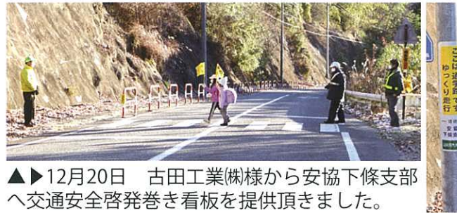
▲▶12月20日 古田工業(株)様から安協下條支部へ交通安全啓発巻き看板を提供頂きました。