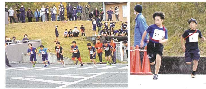
▲11月13日 初めてのリレーマラソン大会が開催されました。