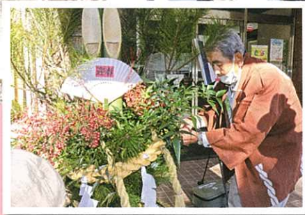
匠の会の皆さんによる 門松づくり