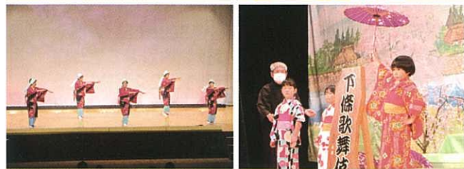
▲11月23日 3年ぶりに文化の祭典が開催、併せて下條歌舞伎伝承300年記念公演も行われました。