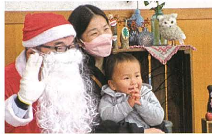
◀12月1日 つどいの広場でクリスマス会を行いました。素敵な飾りを背景に、親子でサンタさんと記念撮影。