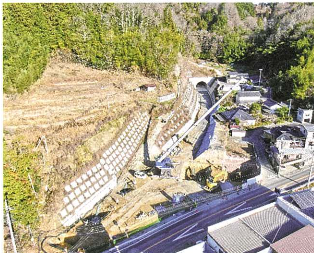
山田河内側トンネル 終点部