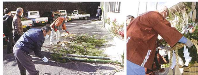
▲12月21日 毎年恒例となった匠の会皆様による門松飾り。今年も匠の技術で作っていただき、村内各所へ飾られました。