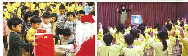
◀▲12月16日 保育所にてクリスマス会を行いました。図書館司書による読み聞かせ、保育士によるマジックショーのあとは、サンタさんが来園。大興奮の子どもたちは、サンタさんからのプレゼントを受け取り、記念撮影を行いました。