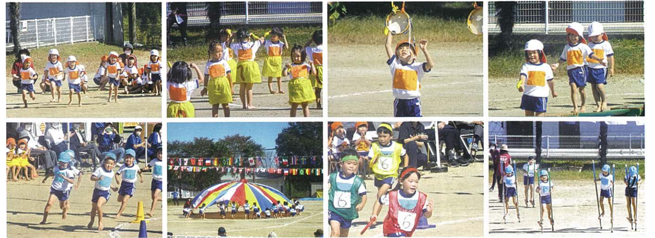
▲10月16日 保育所の運動会が開催されました。秋晴れの空の下、元気いっぱいに練習の成果を披露しました。