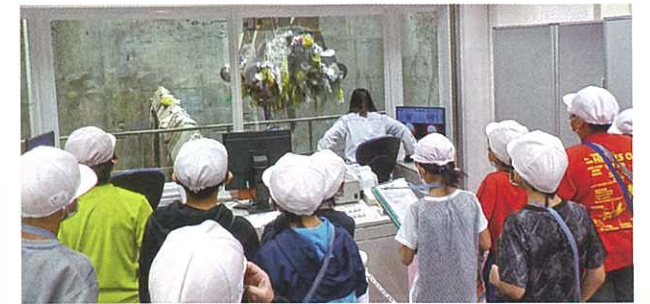
◀▲10月18日 小学校4年生が稲葉クリーンセンターの見学へ行き、後日小学校において燃やすごみを中心としたごみ分別の環境学習が行われました。