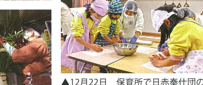
▲12月22日 保育所で日赤奉仕団の皆さんに協力いただき、お餅つき・鏡餅づくりが行われました。