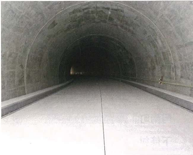
粒良脇トンネル 内部