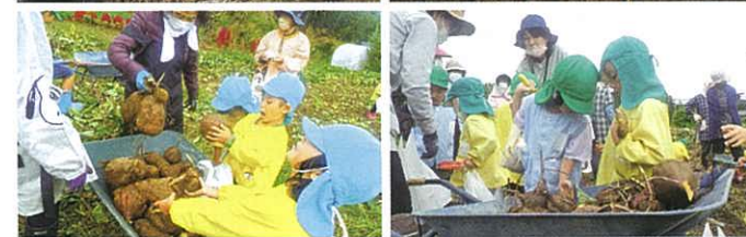
▲10月18日 保育所でもほりを行いました。子どもたちの顔ほどの大きさのさつまいももあり、大豊作でした。