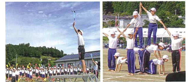
▲10月8日 小学校の運動会が開催されました。前日の大雨で開催が心配されましたが、当日は快晴。子どもたちは全力で競技に取り組むことができました。